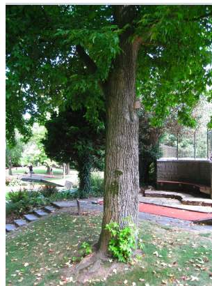
, 29 juillet 2008

XLSX (Excel 2007) - XLS (Excel 1997-2003) .